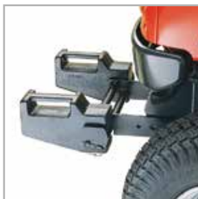
Porte-poids avant / arrière