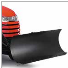
Lame à neige