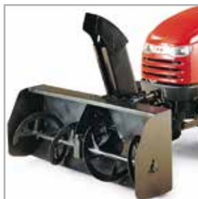
Fraise à neige double étage