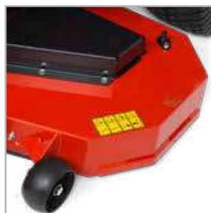
PLATEAU DE COUPE MÉCANO-SOUDÉ Le plateau de coupe mécano-soudé robuste de 132 cm avec partie supérieure, bords latéraux, coins renforcés et bord frontal en acier sera durant de nombreuses années le garant de la durabilité et de la qualité de coupe.