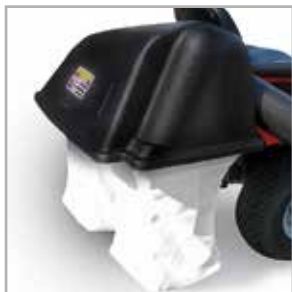
Bac de ramassage à deux sacs