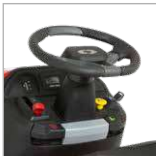
TABLEAU DE BORD PRATIQUE

Le siège réglable à dossier mi-haut de qualité supérieure assure un confort de conduite et une stabilité.