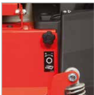
POSITION LEVIERS DE DIRECTION Réglage de la position des 2 leviers de commandes précis pour conduire dans des voies droites.

La tondeuse zéro turn Courier™ constitue le choix parfait pour tout propriétaire sérieux. Elle est dotée d'un plateau en acier embouti de 107 cm ou de 117 cm vous garantira une tonte impeccable. Mieux encore, son plateau de transport arrière* vous permettra d'économiser du temps et des efforts. Toutes les tondeuses zéro-turn Courier™ sont équipées d'un siège confortable avec accoudoirs.