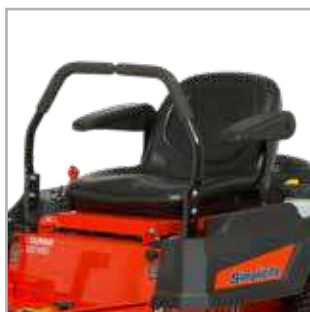
SIÈGE ULTRACONFORTABLE Un siège à dossier mi-haut avec des accoudoirs pour plus de confort durant la tonte.