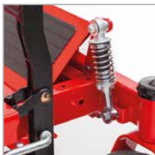
SUSPENSION AVANT ET ARRIÈRE La suspension avant et arrière rend la conduite très confortable et permet une plus grande vitesse de tonte.