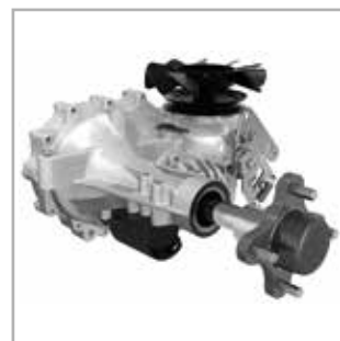
TRANSMISSION PROFESSIONNELLE Les transmissions Hydro-Gear® ZT-2800® vous garantissent robustesse et souplesse.