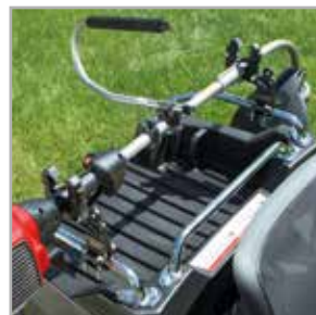
Kit Rhino Grip