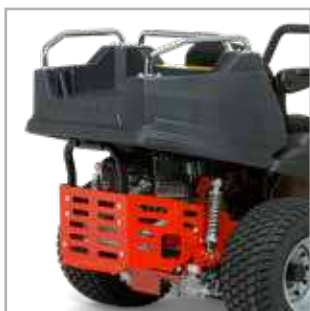
PLATEAU DE TRANSPORT* Polyvalent et adapté aux travaux de jardin.