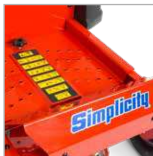
PLAQUE D'APPUI AMOVIBLE La plaque d'appui amovible permet un accès rapide et aisé aux points du plateau devant subir un entretien.