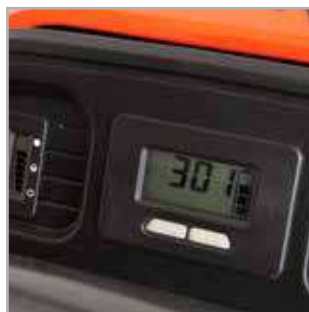
TABLEAU DE BORD PRATIQUE Ce tableau de bord de luxe montre ce dont votre machine a besoin. Il contient une jauge à carburant et un compteur d'heures. La fonction d'interaction prévient l'utilisateur lorsque la machine est en maintenance.

CONTRÔLE DE VITESSE Vitesse de conduite infiniment variable. Ajustez votre vitesse rapidement et facilement.