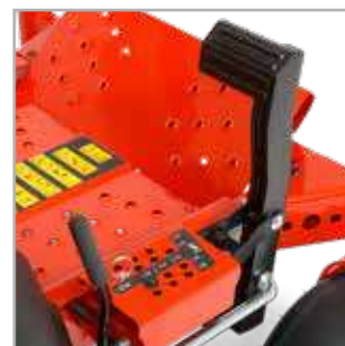
POSITIONS DE COUPE Choix aisé de la hauteur de coupe grâce au mécanisme de relevage du plateau à l'aide d'une pédale.