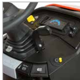
TABLEAU DE BORD HAUT DE GAMME Un système de tableau de bord intuitif à l'instrumentation complète comportant un bouton-poussoir de démarrage, un jauge de carburant et des indicateurs d'entretien, fait vivre à l'utilisateur une expérience de tonte unique.

SYSTÈME ACT™ & BLOCAGE DE DIFFÉRENTIEL Grâce au système Automatic Controlled Traction™ (ACT) et au blocage du différentiel, la puissance motrice est délivrée en permanence aux deux pneus arrière, de manière à assurer une traction supérieure tout en réduisant les dégâts au gazon.