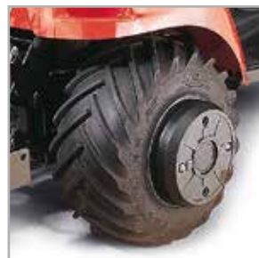
Masse de roue