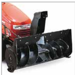
Fraise à neige simple étage