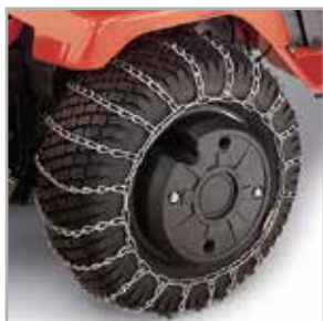
Chaînes à neige