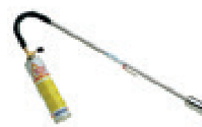
6057.1880 FLAME Jetbrander