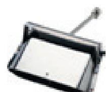
6059.0005 FLAME Powerjet 168mm