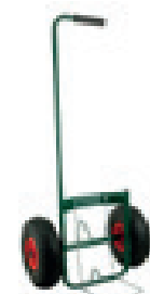
6059.0010 FLAME Powerjet Trolley