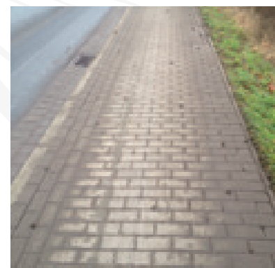
Na 2 weken, schoongeveegd