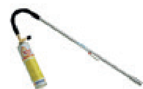
6057.1850 FLAME Puntbrander

Kleine handunits voor selectief bijwerken van ongewenste vegetatie. Eenvoudig te bedienen, goedkoop in aanschaf en uitermate effectief.