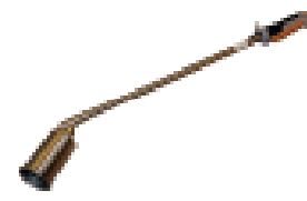
6060.0001 FLAME HB Powerbrander 60mm