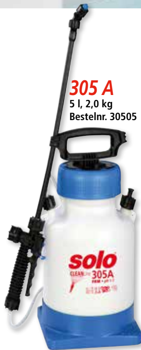
305 A 5 l, 2,0 kg Bestelnr. 30505