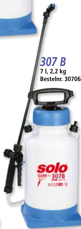
307 B 7 l, 2,2 kg Bestelnr. 30706

De SOLO drukspuiten met schouderriem zijn ideaal voor het reinigen en desinfecteren van grotere oppervlakken of op langere afstanden.