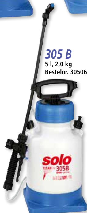
305 B 5 l, 2,0 kg Bestelnr. 30506