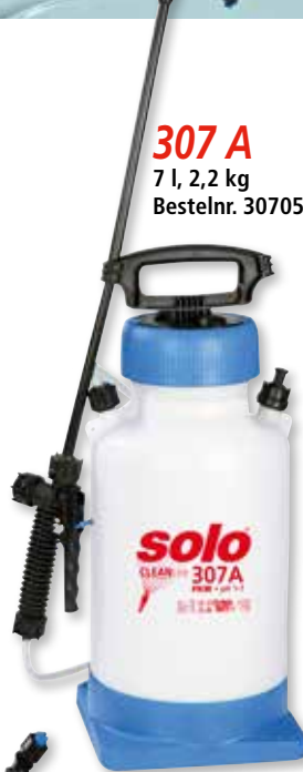
307 A 7 l, 2,2 kg Bestelnr. 30705